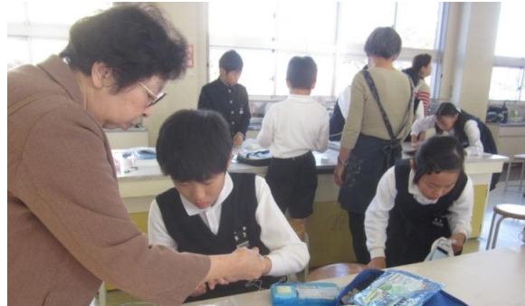
家庭科(裁縫)でミシンの使い方[10/16(木)～: 5年] 【経験豊かな15名の皆さんが、交替で支援】