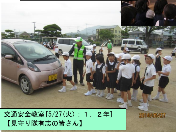
交通安全教室[5/27(火): 1, 2年] 【見守り隊有志の皆さん】