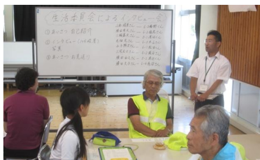
見守り隊代表の方々と生活委員会の懇談会 [6/24(火)]【見守り隊7団体代表者】