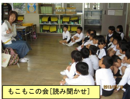
もこもこの会[読み聞かせ]