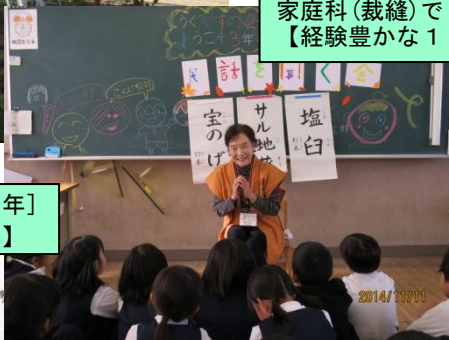
吉備の昔話体験[11/11(火): 3年] 【吉備路伝説を語る会の皆さん】