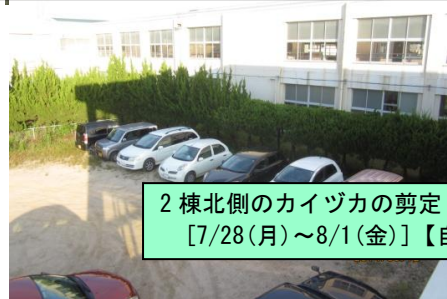
2棟北側のカイツカの剪定 [7/28(月)~8/1(金)]【自称植木屋の皆さん】