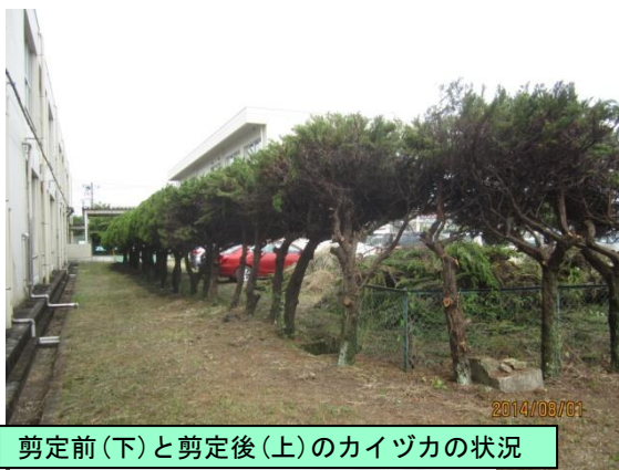
剪定前(下)と剪定後(上)のカイツカの状況