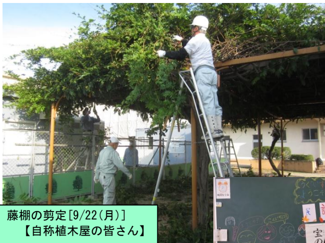
藤棚の剪定[9/22(月)] 【自称植木屋の皆さん】