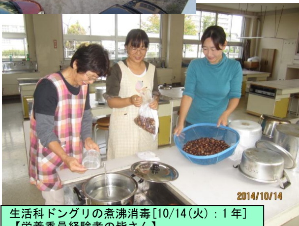
生活科ドングリの煮沸消毒[10/14(火):1年] 【栄養委員経験者の皆さん】