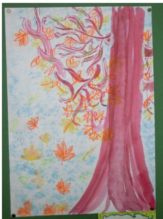
4年生 My Best Friend Tree