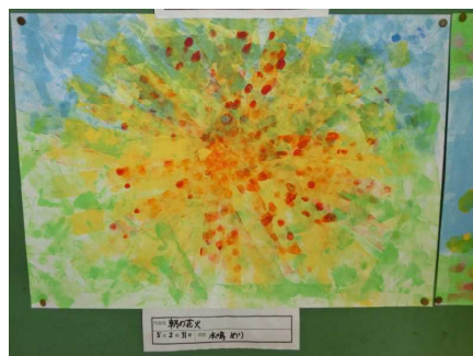
5年生 めざせ ローラの達人