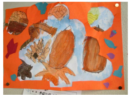
3年生秋みいーつけた