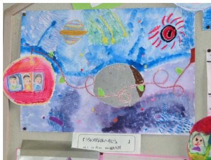
2年生のびるのびーる