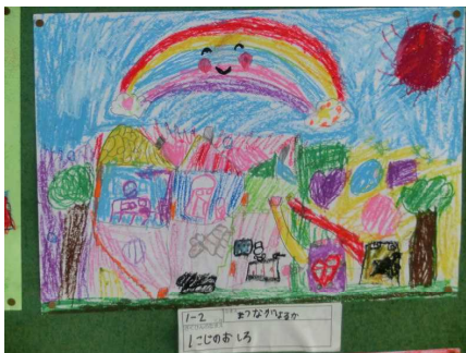
1年生できたらいいなこんなこと

先日の参観日でご覧いただいたと思いますが、芸術の秋にふさわしく各学年思考を凝らした作品が掲示されていますのでごくごく一部ですが紹介します。